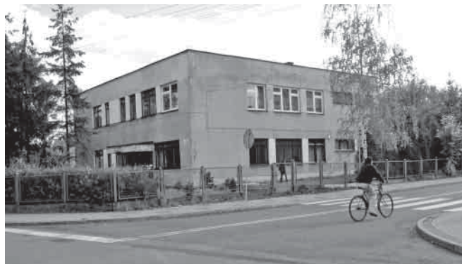
Ośrodek Dziennego Pobytu przy ul. A. Mickiewicza.

– Rozbudowa i modernizacja budynku Ośrodka Dziennego Pobytu przy ul. A. Mickiewicza – cały czas trwają uzgodnienia z projektantem budynku, co do koniecznego