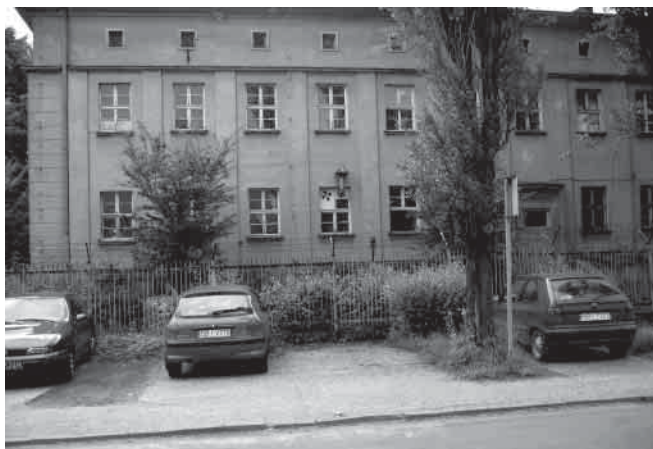
Budynek przy ul. J. Kochanowskiego.

W budżecie gminy na 2007 r. założono realizację inwestycji za ponad 24 mln zł, w tym ponad 3 mln zł na gospodarkę mieszkaniową, m.in. na budowę budynku z lokalami socjalnymi, czy adaptację budynku przy ul. J. Kochanowskiego na lokale socjalne. Ponad 4 mln zł przeznaczono na inwestycje w oświacie, w tym na budowę sali gimnastycznej przy Gimnazjum Publicznym nr 2, na projekty sal gimnastycznych przy SP nr 2 w Ligocie Miliardowicach i w SP nr 3 w Ligocie, na budowę boiska przy Zespole Szkół w Ligocie, blisko 3 mln zł na inwestycje na drogach publicznych gminnych, blisko 400 tys. zł na administrację publiczną, w tym na projektowanie budynku Urzędu Miejskiego, 1,7 mln zł na inwestycje w kulturze m.in. na wykonanie elewacji Miejskiego Domu Kultury, czy na projektowanie budynku Miejskiej Biblioteki Publicznej, blisko 8 mln zł na inwestycje sportowe, z czego większość na budowę krytego basenu na MOSiR.