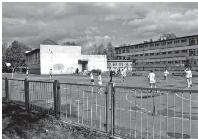
Gimnazjum Publiczne nr 2.

Przesuwa się w czasie realizacja inwestycji – budowa sali gimnastycznej przy Gimnazjum Publicznym nr 2. – Najwyraźniej inwestycja ta może mówić o przysłowiowym pechu. To już drugi unieważniony przetarg – powiedział burmistrz Stanisław Czyż. – Trzeci, mamy nadzieje udany, został ogłoszony 23 lipca br. Pierwszy przetarg został unieważniony, ponieważ złożone przez firmy, biorące udział w przetargu, oferty cenowe przekraczały środki finansowe zarezerwowane na ten cel w budżecie. W drugim przetargu wyłoniono oferenta. Niestety wyłoniona w nim firma „Kaja” z Żywca nie wniosła wymaganego zabezpieczenia należącego do wykonania zadania, co uniemożliwiło podpisanie umowy na roboty budowlane. Firma straciła wadium, tj. 31 tys. zł, ale widocznie dla firmy to żadna strata – powiedział zastęp-